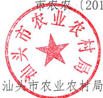
汕头市农业农村局