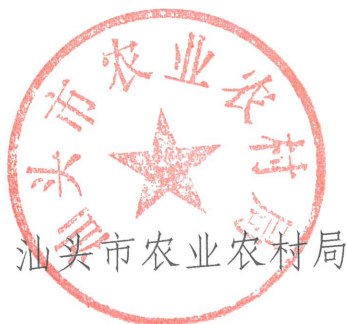
汕头市农业农村局

为建立健全农村宅基地审批管理机制，进一步规范农村宅基地管理工作，市农业农村局会同市自然资源局、市住房和城乡建设局制定了《汕头市农村宅基地审批管理工作指引（试行）》，现印发给你们，供各地结合实际参照执行。