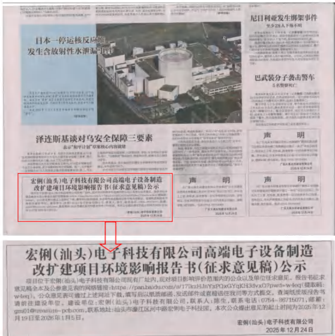
图 3.2-2 征求意见稿公示信息第一次刊登报纸截图