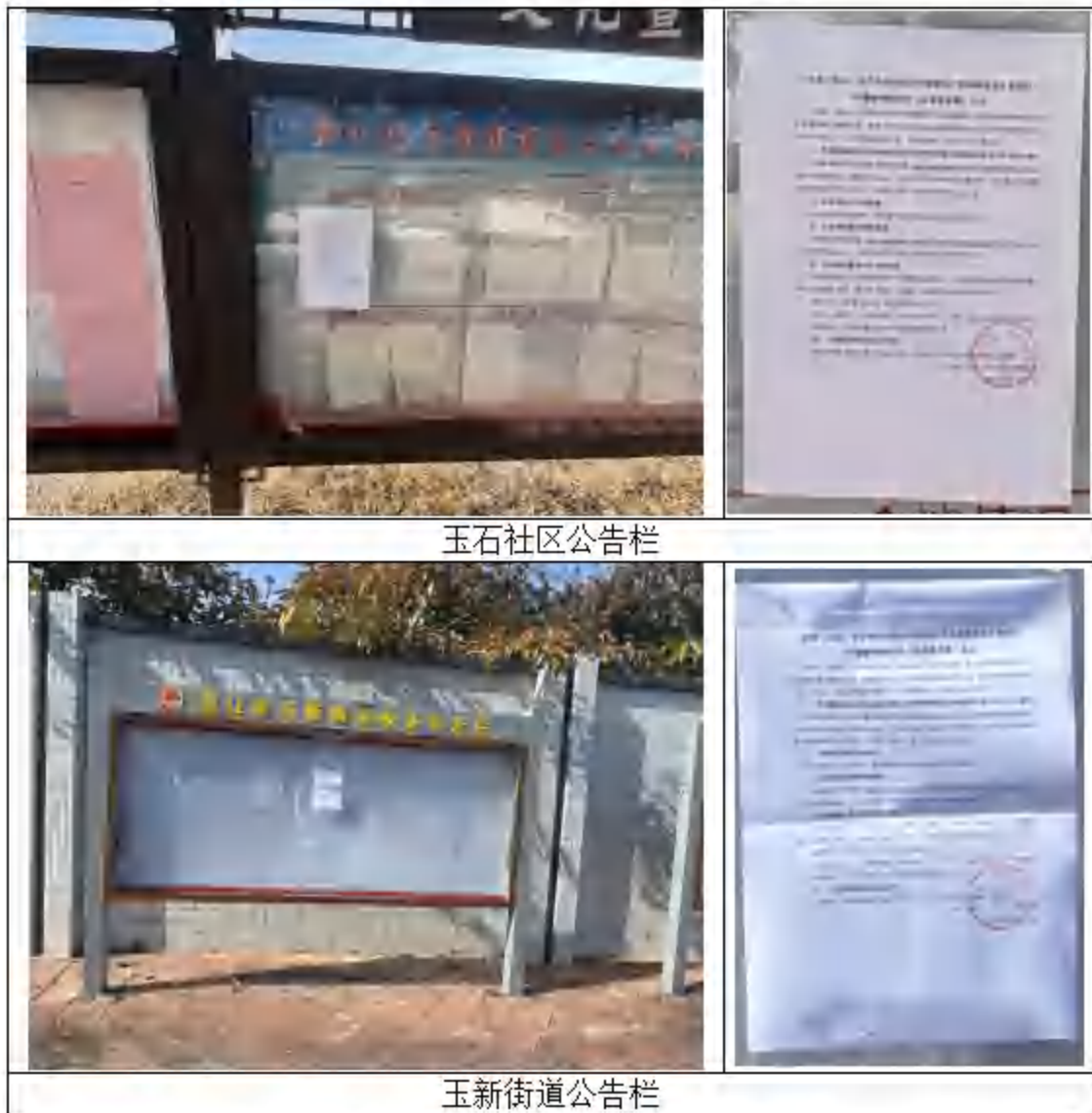
图 3.2-4 征求意见稿公示信息的张贴图