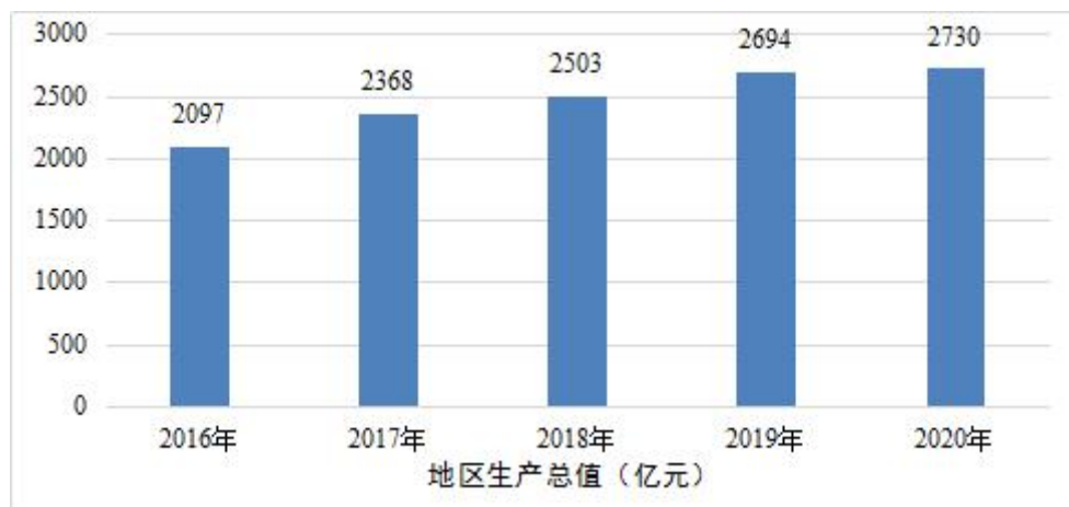
图1 “十三五”时期全市生产总值增长情况（单位：亿元）

创新能力有效提升。 全社会研究与试验发展经费投入年均增长 23%，占地区生产总值比重从 2015 年的 0.66% 提高到 2019 年的 1.05%。汕头高新区升格为国家级高新区，龙湖工业园区获批省级高新区，濠江区获批建设省级农业科技园区，化学与精细化工广东省实验室、粤港新发传染病联合实验室等高端创新平台获批设立。全市共有国家企业技术中心 2 家、省级新型研发机构 9 家、省级重点实验室 8 家、省级工程技术研究中心 200 家。高新技术企业从 2015 年的 150 家增至 648 家。拥有省“珠江人才计划”团队 1 个、省“扬帆计划”团队 5 个、省科技创新创业领军人才 2 名，引进外国高端人才（A 类）和专业人才（B 类）共 306 名。汕头大学管轶、朱华晨团队荣获国家科学技术进步奖特等奖。获批国家知识产权示范城市，每万人发明专利拥有量达到 5.17 件。