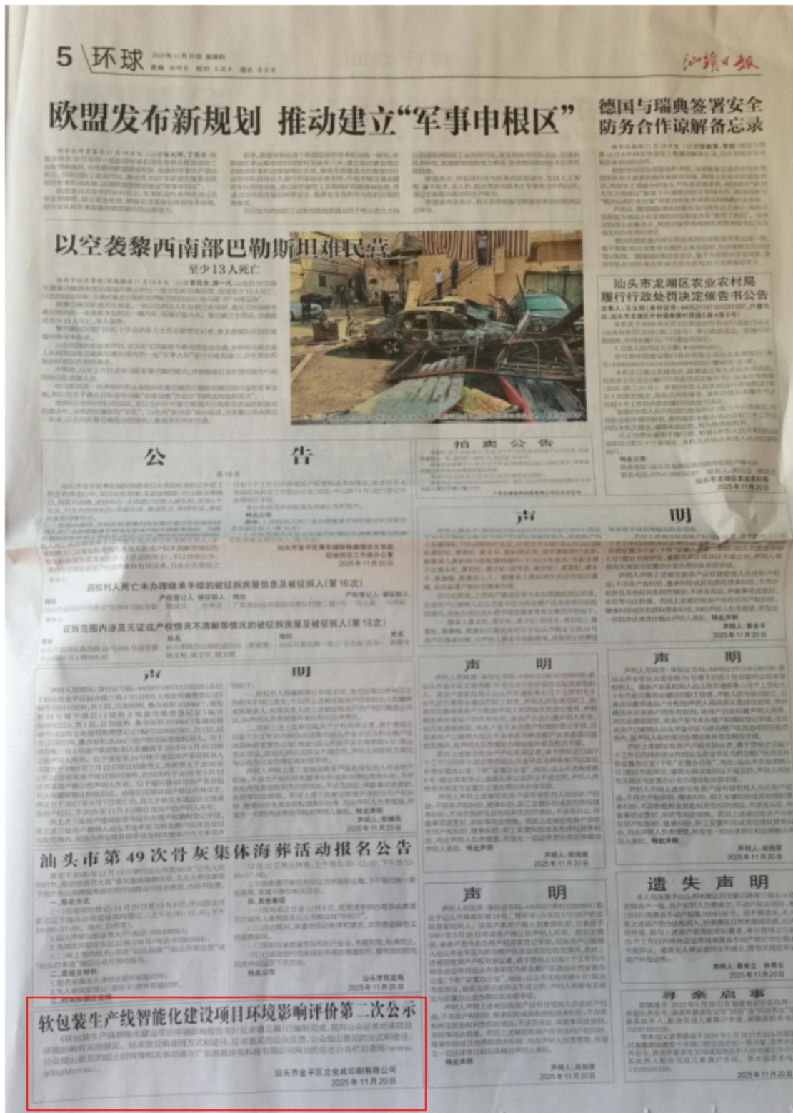
(2) 我单位《软包装生产线智能化建设项目环境影响报告书》(征求意见稿)的2025年11月21日第二次报纸公示照片见下图。